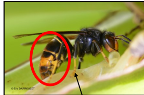
Extrémité des pattes de couleur jaune