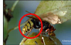
Extrémité des pattes de couleur brune